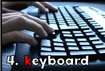
4. k eyboard