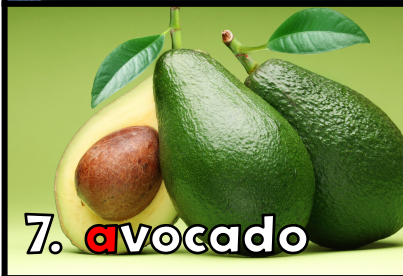
7. a vocado