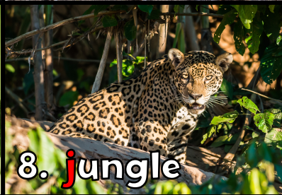
8. j ungle