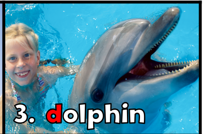
3. d olphin