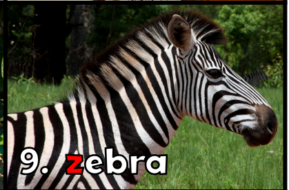
9. z ebra