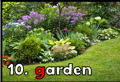
10. g arden