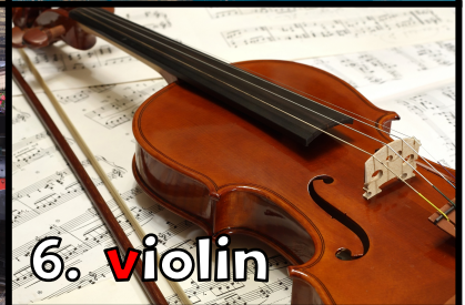
6. v iolin