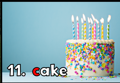
11. c ake