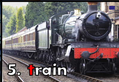
5. t rain