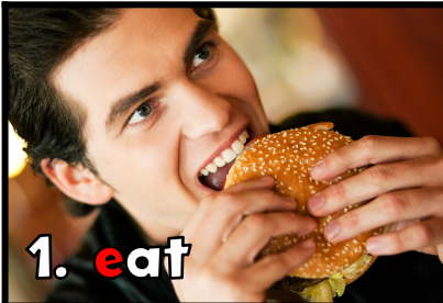
1. e at