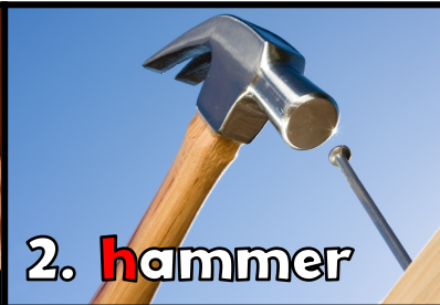
2. h ammer